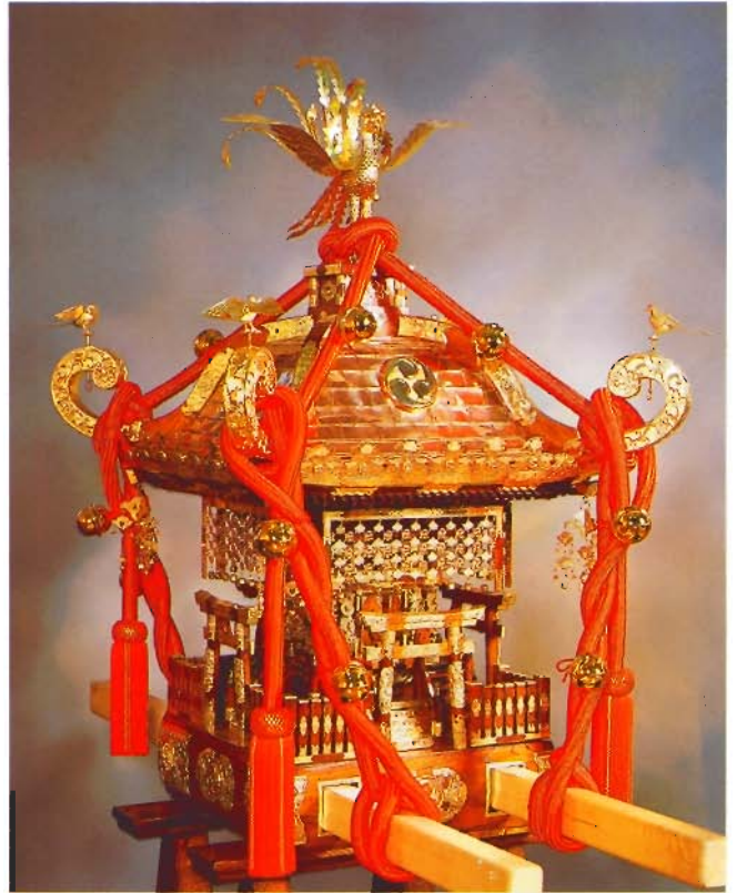
神輿 檜2尺 (富山)