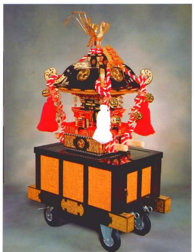
神輿1尺3寸(富山)A型 と神輿A型用台車(富山)