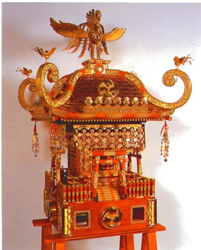
神輿 檺3尺 (富山)