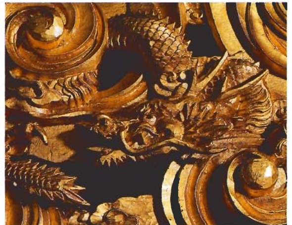
社彫刻 (蠟型合金製)

偉大なる自然に 夢をたくし 自然への感謝と みのりを願う心が 祭を生んだ。 未来をになう 子供達に 育ててゆきたい 日本の心