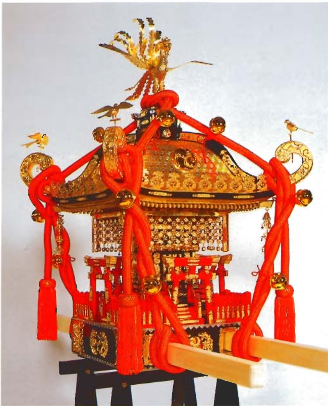
神輿 2尺 (富山)E型