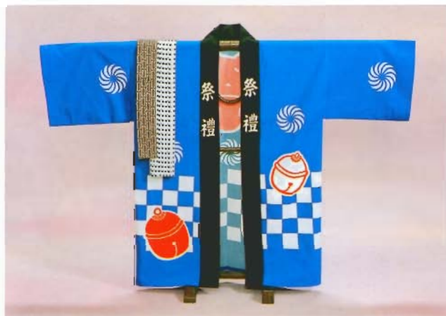
大人用ハッピー（富山）